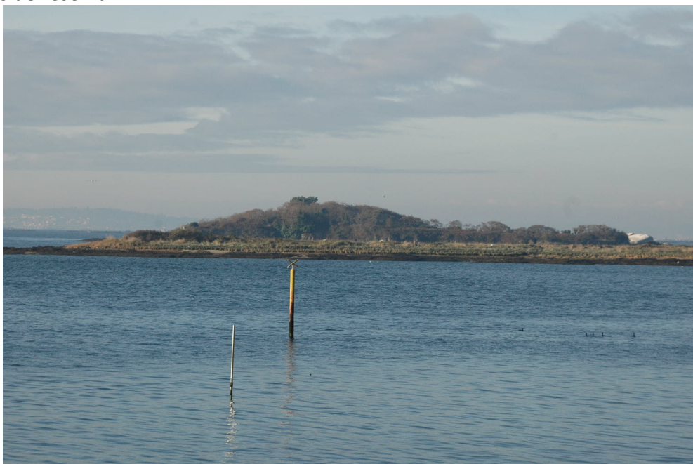
As Malveiras desde a costa oeste de Cortegada

Descrición do itinerario: O percorrido parte desde a mesma praia onde desembarcamos. Desde aquí veremos algunhas das construcións máis emblemáticas entre as poucas que quedan en pé en Cortegada: a ermida, xunto á cal antano había un pequeno hospital, e un dos tres cruceiros que existen no arquipélago, sinais do camiño marítimo en dirección a Santiago de Compostela. Para realizar o itinerario no sentido das agullas do reloxo collemos o sendeiro que sae cara ao oeste, un pouco antes de chegar á ermida; xa non teremos que saír del, pois bordea toda a illa abeirando o mar, e permitíranos admirar a riqueza natural de Cortegada sen transitar polo interior das zonas especialmente sensibles, como os bosques de loureiros. A primeira parte do camiño discorre pola beira oeste, e nela podemos ver os demais illotes que compoñen o arquipélago: a Malveira Grande e o seu singular bosque de cerquiños, a Malveira Chica, O Con e Briñas, todos eles catalogados como zonas de reserva.