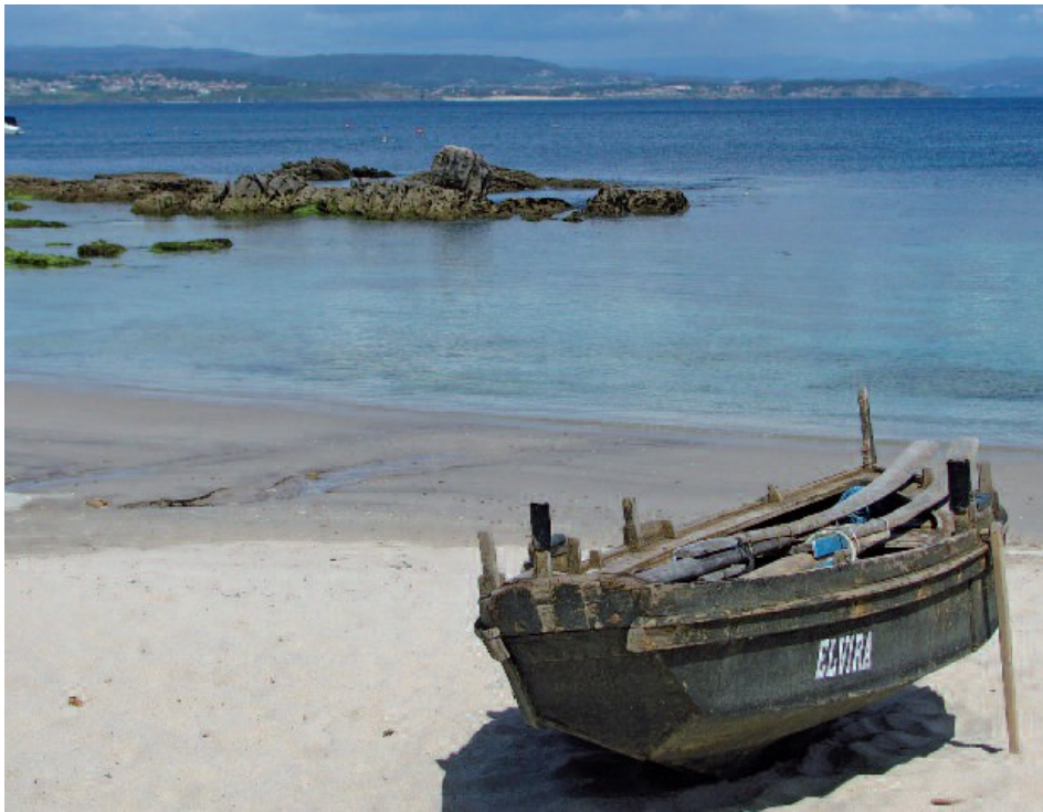
A Elvira repousando solitaria na praia

Subindo as escaleiras ao lado da fonte hai unha pequena zona de descanso con mesas e bancos de madeira, que atravesamos para coller a senda que discorre en dirección norte paralela á liña da costa. Os fondos rochosos, predominantes neste arquipélago, vense con claridade desde este tramo, sobre todo se o noso paseo coincide coa baixamar. Cruzamos unha pequena valgada onde os salgueiros revelan a presenza de auga doce, máis abundante aquí que nas veciñas Cíes. Á altura dun pequeno claro situado un pouco máis adiante, mirando cara á esquerda, vemos aparecer a lanterna do faro de Ons, a 128 m sobre o nivel do mar. O camiño, que agora avanza por un corredor de espiños, abruñeiros, xaras, toxos e fentos, lévanos nuns 15 minutos desde a caseta ata o miradoiro do Castelo. Da antiga fortificación de carácter defensivo que antano se alzaba neste estratéxico lugar só quedan as ruínas dos muros, desde os cales podemos gozar das vistas de toda a costa oriental da illa de Ons e da ría de Pontevedra.