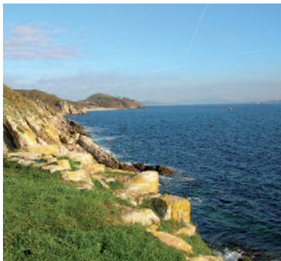
Vistas ao norte desde as ruínas do Castelo

Subindo as escaleiras ao lado da fonte hai unha pequena zona de descanso con mesas e bancos de madeira, que atravesamos para coller a senda que discorre en dirección norte paralela á liña da costa. Os fondos rochosos, predominantes neste arquipélago, vense con claridade desde este tramo, sobre todo se o noso paseo coincide coa baixamar. Cruzamos unha pequena valgada onde os salgueiros revelan a presenza de auga doce, máis abundante aquí que nas veciñas Cíes. Á altura dun pequeno claro situado un pouco máis adiante, mirando cara á esquerda, vemos aparecer a lanterna do faro de Ons, a 128 m sobre o nivel do mar. O camiño, que agora avanza por un corredor de espiños, abruñeiros, xaras, toxos e fentos, lévanos nuns 15 minutos desde a caseta ata o miradoiro do Castelo. Da antiga fortificación de carácter defensivo que antano se alzaba neste estratéxico lugar só quedan as ruínas dos muros, desde os cales podemos gozar das vistas de toda a costa oriental da illa de Ons e da ría de Pontevedra.