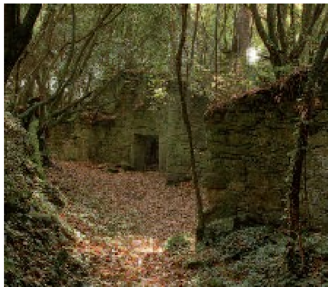
A antiga vila, conquistada pola vexetación

Hoxe só quedan en pé algunhas fachadas, entre as que medran inmensos loureiros que lle dan un aire misterioso e máxico ao conxunto. Antes de rematar o noso percorrido, xa de volta á praia, pasamos preto da vivenda restaurada dos caseiros que custodiaron a propiedade do rei durante anos, converténdose nos derradeiros habitantes da illa.