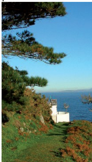
O pequeno faro de Monteagudo, que vixía a entrada norte da ría de Vigo

Desde este lugar privilexiado podemos observar sen incomodalos os centos de corvos mariños e gaivotas que se concentran nestas esgrevias ladeiras durante a época de cría, enchéndoas cunha incesante e buligante actividade. Aínda que desde aquí podemos ver o faro a poucos metros, cómpre retroceder un chisco e descender por unha verea a man esquerda que nos leva ata el. A silueta da Costa da Vela, a tan só 2,5 km, fai deste punto o lugar do arquipélago máis próximo ao continente, onde desde 1904 un pequeno faro automatizado guía a entrada dos barcos á ría de Vigo. Ao norte perfílanse as illas de Ons e Onza, que protexen a ría de Pontevedra. Se seguimos a pista de pedra que parte desde o faro, podemos achegarnos ata unha furna, unha pequena representación das grandes covas mariñas da vertente oeste, que son resultado do constante bater das ondas e da peculiar estrutura do granito, que fai que se fracture en vertical. O regreso ata a bifurcación situada ao pé de Monteagudo farémolo pola senda que bordea o litoral e que, en varios puntos, nos permite gozar da vista, ao sur, da Costa de Cantareira, Punta Muxieiro e mesmo a silueta da costa de Baiona. Unha vez alí, só temos que desandar o camiño ata a caseta de información, a onde regresaremos despois dunhas dúas horas de agradable paseo.