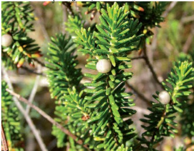
Detalle dos froitos da camariña, unha das xoias botánicas do Parque

trasdunares, e a escasísima herba de namorar ( Armeria pungens ), unha especie que non ten presenza constatada ata a costa sur portuguesa, sendo esta a súa localización máis setentrional.