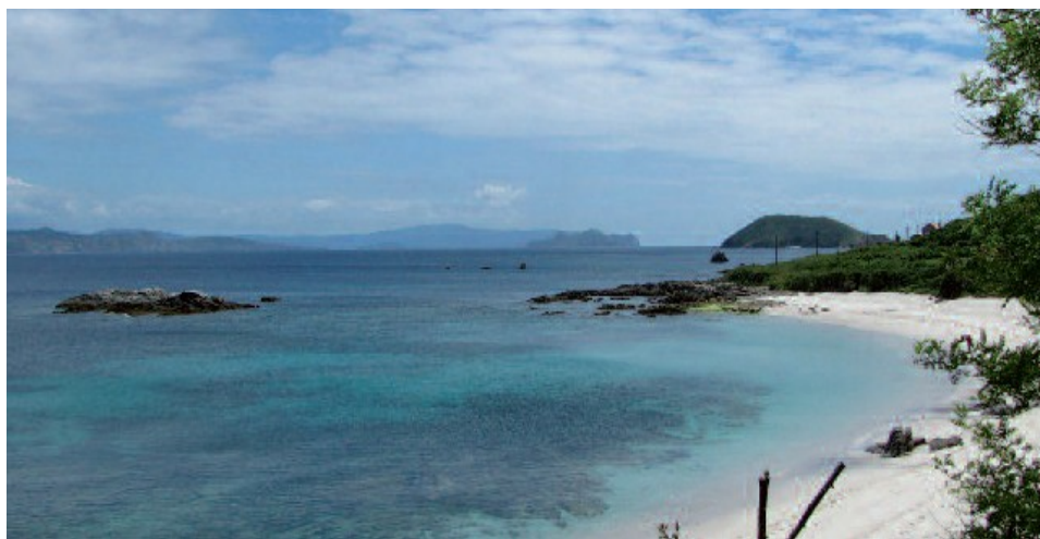
A praia de Area dos Cans, co illote onde se atopa a Laxe do Crego

Pouco despois chegamos á praia de Canexol, co seu fráxil sistema dunar, actualmente en proceso de recuperación. Na outra banda do camiño consérvase aínda a antiga reitoral cos seus tradicionais hórreos; e, detrás dela, xa a media ladeira, o cemiterio e a vella igrexa. As vivendas que atopamos ao longo do camiño, algunhas delas habitadas, forman parte dos barrios de Canexol e Pereiró, onde chegaremos tras 20 minutos de agradable paseo. Alí están as instalacións que dan servizo aos campamentos de verán que a Xunta de Galicia organiza desde hai anos. O camiño continúa ascendendo e desviándose cara á esquerda, ofrecendo como referencia un esvelto piñeiro solitario entre a mesta vexetación de matogueira, para acabar desembocando ao cabo duns 45 minutos