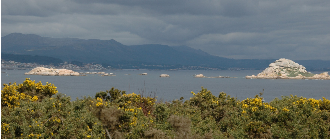
Sálvora e os seus illotes, sentinelas protectoras da ría de Arousa

-Descrición do itinerario: Desde o peirao seguimos o itinerario anterior ata chegar a unha bifurcación á dereita do camiño principal, a uns 400 m do comezo do percorrido. O camiño ascende con suavidade, o que nos permite contemplar a ría de Arousa desde unha nova e espectacular perspectiva, co imponente illote rochoso de Noro en primeiro plano, seguido por Herbosa, Gavoteira e Vionta, que garda unha das xoias botánicas do Parque Nacional, a xesta Cytisus insularis .