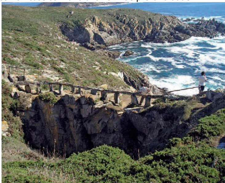
O Buraco do Inferno, unha entrada ao averno segundo as lendas

Volvendo atrás un chisco sobre os nosos pasos, continuamos cara ao oeste para achegarnos ao Buraco do Inferno (1 h 30 m), unha sima creada polo poderoso bater do océano; esta curiosa formación xeolóxica comunícase co mar a uns 40 m de profundidade.