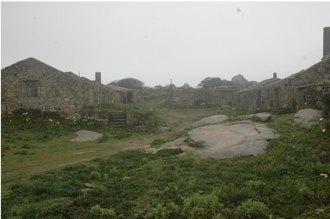
A aldea de Sálvora, situada nun lugar privilexiado

A medio camiño, un grupo de salgueiros indícanos que podemos ver á nosa esquerda a fonte de Santa Catarina, anteriormente coñecida como fonte da Telleira, a máis importante da illa. Cando estamos a piques de chegar á aldea, podemos observar o antigo lavadoiro, convertido nun lugar idóneo para a reprodución e cría da poboación de tritón ibérico da illa. A aldea, que hoxe está nun estado de conservación precario, chegou a acoller unha poboación de 60 persoas, mais quedou abandonada de forma definitiva a finais dos anos 70.