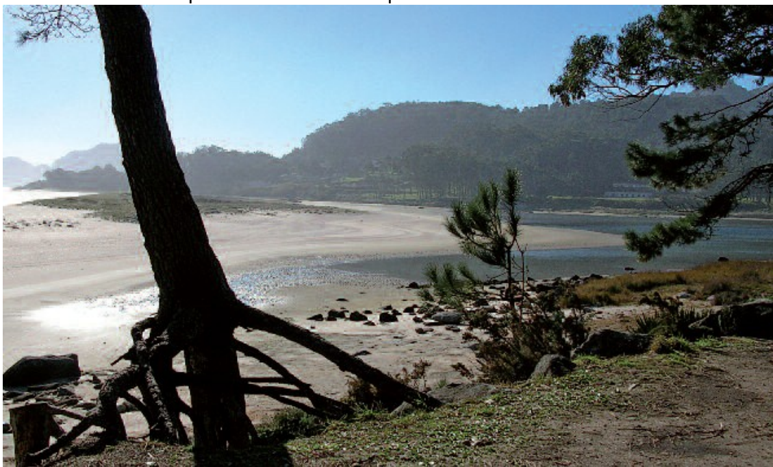
Vista do espectacular complexo praia-barreira-lagoa de Rodas

Desde a caseta de información collemos o camiño de rodeiras de cemento que parte en dirección sur á esquerda da caseta, e seguímolo ata a encrucillada principal da illa do Faro (25-30 minutos), onde enlazamos coa pista forestal debidamente sinalizada que ascende ao faro. Ao longo dos seus primeiros metros poderemos gozar da espectacular praia de Rodas, que ten case quilómetro e medio de lonxitude, une as illas de Monteagudo e Faro, e mostra a acción dinámica dos ventos e as correntes mariñas coa súa peculiar formación de praia-barreira.