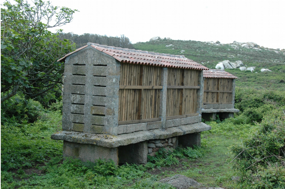
Os hórreos, as despensas de Sálvora

O sendeiro continúa rodeando a illa, o que nos permite pasear entre os hórreos onde os habitantes gardaban as colleitas e que foron restaurados recentemente. Saímos do camiño que nos levou á aldea pasando baixo un dosel de abruñeiros e loureiros, e regresamos de volta ao peirao en aproximadamente 30 minutos.