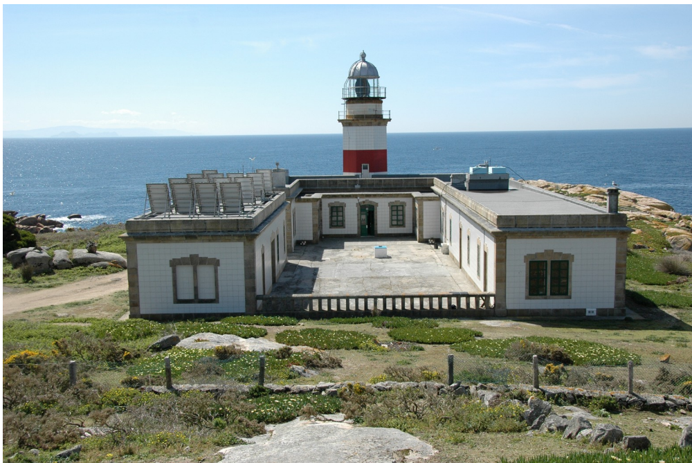
Igual que os navegantes, o faro de Sálvora guía o noso camiño

Camiñando ao pé do monte Gralleiros, coas vistas de Ons (e mesmo das Cíes en días claros) ao sur, chegamos ao actual faro de Sálvora, onde os fareiros aínda traballan para que os barcos, guiados pola súa luz, cheguen a bo porto, como leva acontecendo desde 1921, ano en que o naufraxio do vapor Santa Isabel marcou o inicio dos seus labores.