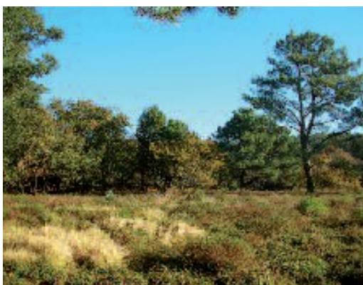
A pradería, unha sorpresa no interior de Cortegada

Descrición do percorrido: O itinerario é igual ao anterior ata chegarmos ao eucaliptal situado despois da praia do Batel, na parte norte da illa. Alí, un poste indícanos a posibilidade de acurtar o percorrido a través dun sendeiro que atravesa a illa, levándonos durante uns minutos polo interior dun bosque máxico de carballos, castiñeiros, piñeiros centenarios e loureiros, que ademais é hábitat de valiosas especies como o espectacular escornabois ou vacaloura ( Lucanus cervus ), un escaravello protexido a nivel europeo.