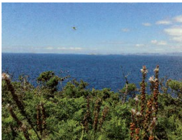
O sendeiro regálanos a vista de Sálvora envolta no azul do océano

A altitude indícanos que estamos próximos ao faro, ao cal podemos achegarnos se nos desviamos uns minutos en dirección ao heliporto (desde onde se admira mellor a imponente edificación), na encrucillada onde se xuntan a ruta que seguimos, a pista que vén do faro e a senda que leva a Punta Liñeiros. Continuamos, xa en suave descenso, cara ao sur, gozando da airexa do mar e do perfil da enseada de Caniveliñas. Neste tramo do camiño poden observarse robustos exemplares de Cytisus insularis , unha especie de xesta que, polo de agora, só foi descrita en Ons e Sálvora.