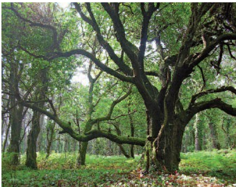
Un espectacular estripeiro, mostra do bo estado e variedade da vexetación arbórea de Cortegada

Pouco despois da praia do Batel, a vexetación autóctona comeza a perder terreo debido á proliferación de eucaliptos e piñeiros, que nestes momentos están encadrados nun plan de