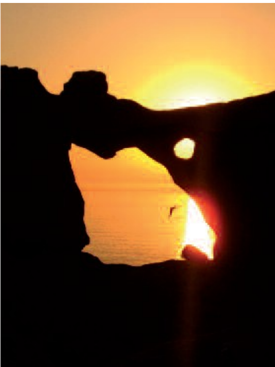
O solponse tras da Pedra da Campá

Xa de volta no camiño principal, seguimos ascendendo por unhas costentas curvas finais ata chegarmos ao cumio do monte, onde se atopa o faro. Desde alí, rodeados de gaiotas que xogan