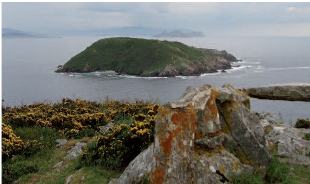
O miradoiro de Fedorentos, un balcón ao océano

desde o inicio da ruta no fermoso miradoiro de Fedorentos, desde onde poderemos gozar dunhas magníficas vistas da costa, coa redonda illa de Onza en primeiro plano e o espectacular perfil das Cíes detrás.