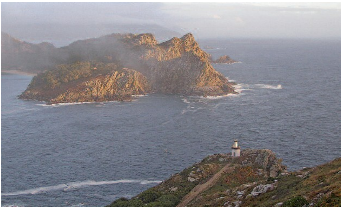
O faro da Porta, que vixía o denominado Freu da Porta, un estreito canal que separa San Martiño da illa do Faro

anxélicas son exemplos de plantas propias dos cantís que podemos atopar na veciñanza do faro. Aquí tamén gozaremos dunha magnífica panorámica da illa Sur, na cal destacan a Punta e a Furna da Galeira, un impresionante acantilado coroado por unha cruz de pedra erixida en memoria dos 26 mariñeiros de Moaña que pereceron no naufraxio do Ave do Mar en 1956. Por último, se miramos cara á ladeira do monte do Faro, observaremos entre a vexetación os restos do denominado castro das Hortas, un antigo poboado castrexo que constitúe o depósito arqueolóxico máis importante atopado ata o momento no arquipélago das Cíes.