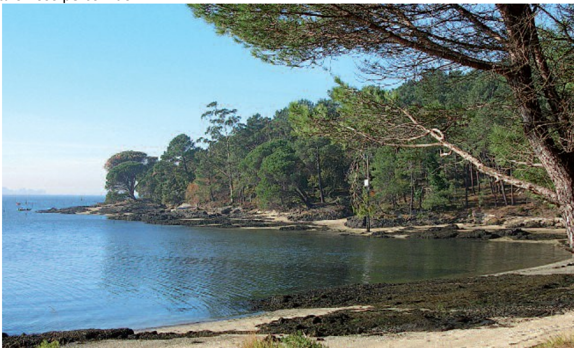
A tranquila praia de Sartaxéns, fronte á vila de Carril

Sáímos ao camiño perimétrico fronte á praia de Sartaxéns e seguimos en dirección oeste, deixando o mar á nosa esquerda ata chegar primeiro á antiga vila e logo á caseta de información, onde remata o noso percorrido.