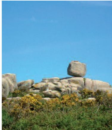
Sálvora, unha illa de esculturas

Xa no camiño principal, as caprichosas formas dos enormes penedos de granito que iremos contemplando mostrarannos a dureza da vida nas illas, marcada polo vento, a area, a chuvia e o sal.