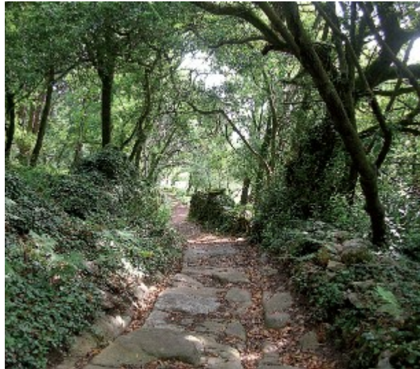
Chegada á vila a través do Camiño do Carro

erradicación de especies alóctonas. O cruceiro de Punta Corveiro, no extremo nordeste da illa, marca o comezo da zona de aproveitamento marisqueiro, como mostran as parcelas de cultivo e os milleiros de cunchas que se acumulan nas beiras, xa fóra dos límites do Parque Nacional. Coas primeiras casas de Carril ante nós, pasamos polo punto da illa máis próximo ao continente. Aquí, a través do Camiño do Carro, antano transportábanse centos de quilos de algas, que supuñan un inmellorable fertilizante para as leiras. A xentes da zona, que contan con experiencia e coñecementos sobre o terreo, aínda son capaces de cruzaren a pé por este lugar para chegar á illa cando o réxime de mareas o permite. Tras deixarmos atrás unha pequena praia e un amieiral de grande importancia que queda á nosa dereita, achegámonos pouco e pouco ás ruínas da vila de Cortegada, abandonada despois das expropiacións executadas cando se lle doou a illa a Afonso XIII.