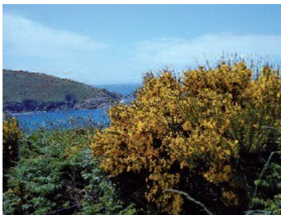
Xestas de Ons dándolle cor ao sendeiro de Caniveliñas

A altitude indícanos que estamos próximos ao faro, ao cal podemos achegarnos se nos desviamos uns minutos en dirección ao heliporto (desde onde se admira mellor a imponente edificación), na encrucillada onde se xuntan a ruta que seguimos, a pista que vén do faro e a senda que leva a Punta Liñeiros. Continuamos, xa en suave descenso, cara ao sur, gozando da airexa do mar e do perfil da enseada de Caniveliñas. Neste tramo do camiño poden observarse robustos exemplares de Cytisus insularis , unha especie de xesta que, polo de agora, só foi descrita en Ons e Sálvora.