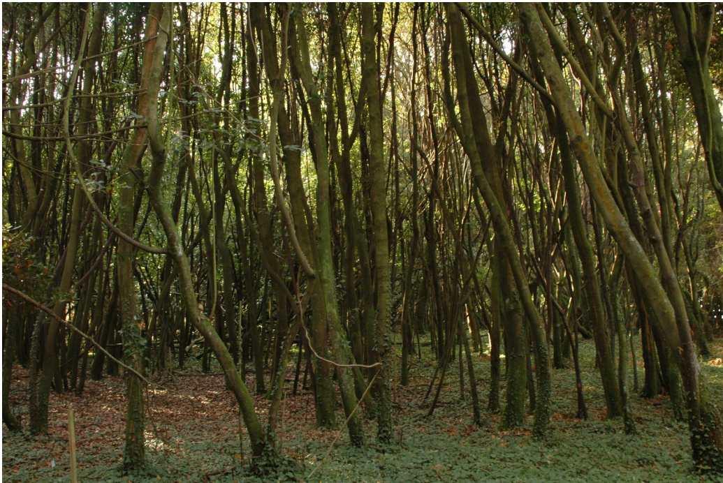
O loureiral de Cortegada

Unha vez deixamos atrás un par de grandes piñeiros, podemos empezar a contemplar algunhas das especies arbóreas representativas da illa: o carballo e o cerquiño, cuxa diferenza queda patente ao comparar varios dos exemplares que dan sombra ao camiño; os salgueiros, algúns deles cun importante diámetro; e os loureiros, espectaculares pola súa idade, altura e densidade, o que converte este loureiral no máis importante da península. Unha carballeira moi ben conservada completa a riqueza da parte noroeste da illa.