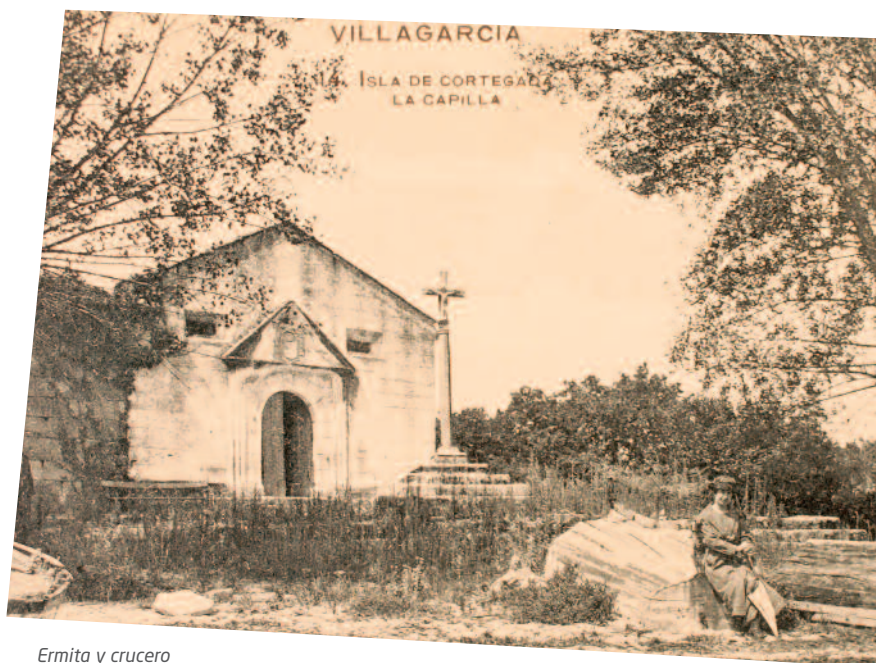
Ernita y crucero