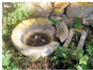
Ruinas del poblado, canales y pías