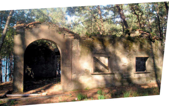
Este cuartel anexiona antiguas cuadras y posiblemente un molino por la presencia de dos piedras de molienda

En la parte occidental que mira a Malveiras, se sitúa esta construcción en piedra con una enorme puerta rematada en un gran arco más o menos moderno.