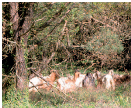
La ganadería era una actividad común en la isla