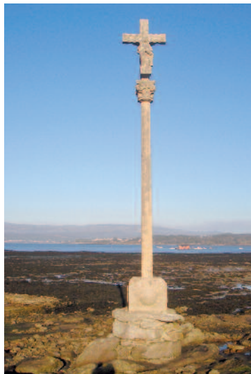
Crucero en punta Corveiro

Uno se sitúa en punta Corveiro y en su base se observa la concha y la cruz del peregrino. Otro, con Cristo crucificado en la cruz, es la antesala a la capilla. Y el tercero se localiza en la isla Malveira Grande.