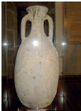
Anfora romana encontrada en las aguas de Cortegada

Se hallaron 3 ánforas completas y restos de otras 20 pertenecientes al imperio romano, y también algunos pecios asociados a esta época.