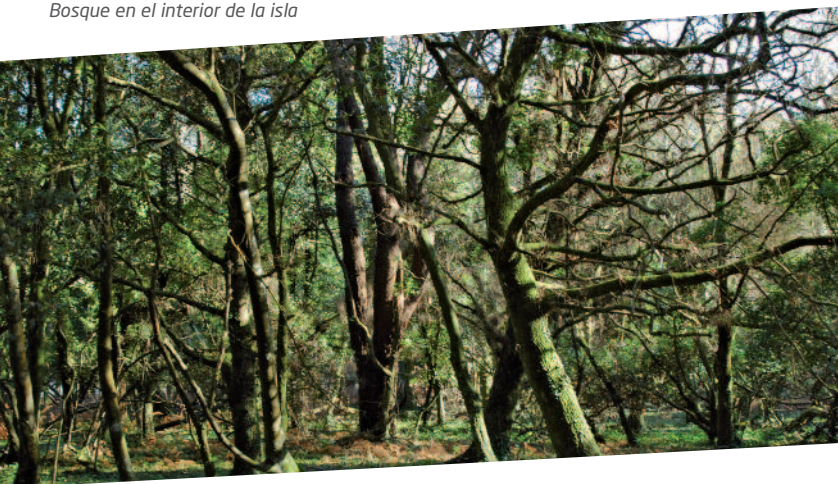
Bosque en el interior de la isla

Durante la República la isla pasó a manos del Estado – 1931, tras el exilio de los monarcas-, y en ella se destinó un grupo de carabineros, la guardia de asalto, para su custodia. En 1958 el territorio es recuperado por los Borbones y, D. Juan de Borbón, efectúa su venta en el 78 a la inmobiliaria "Cortegada S.A.", que enseguida planeó su urbanización alegando una gran ocasión para el turismo.