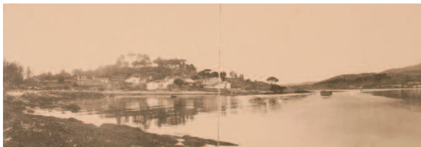
Isla de Cortegada. Vista Parcial de la Isla y de la Ría

Los defensores de su riqueza natural y paisajística: familias isleñas, vecinos y usuarios tradicionales, consiguieron frenar su actuación y en el año 2001 el gobierno autonómico trató de incorporarla al patrimonio público. En el año 2002, se incluyó en el Parque Nacional de las Islas Atlánticas, a pesar de su condición de propiedad privada en manos de "Cortegada S.A." En 2007, coincidiendo con el aniversario de la donación, la Xunta de Galicia paga 1,8 millones de euros fijados como justiprecio por el Jurado de Expropiaciones, y el archipiélago de Cortegada es de nuevo de dominio público. Sus defensores celebran en la isla, en compañía del presidente de la Xunta, el "triumfo" tan esperado.