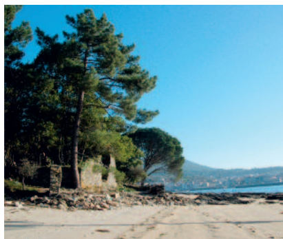
El poblado próximo a la playa y muelle

La ruta establecida por el río Ulla para llevar a Santiago las "riquezas" de , fue un gran atractivo para los vikingos, quienes usaron la isla como campamento base estratégico para planificar, desde aquí , sus ataques para hacerse con el codiciado botín.