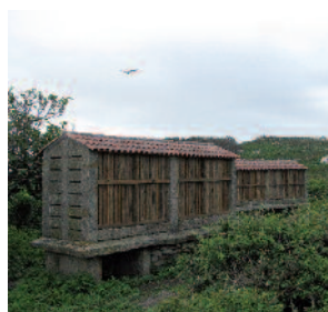
Hórreos, las despensas de Sálvora

El sendero continúa rodeando la aldea, lo que nos permitirá pasear entre los hórreos que guardaban las cosechas de sus habitantes y que han sido recientemente restaurados. Saldremos al camino por el que llegamos a la aldea tras pasar bajo un dosel de endrinos y laureles y regresaremos de nuevo al muelle en aproximadamente 30 minutos.