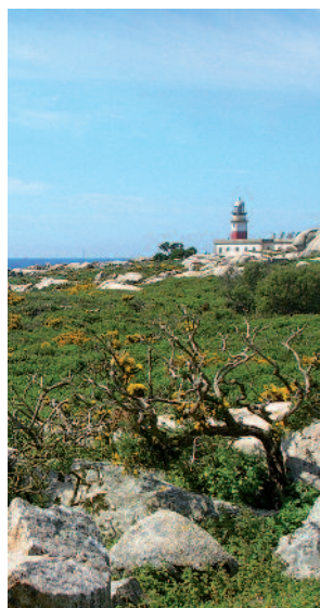
Como a los navegantes, el Faro de Sálvora guía nuestro camino.

Caminando al pie del monte Gralleiros, con las vistas de Ons al sur e incluso de Cíes en días claros, llegaremos hasta el actual Faro de Sálvora, en el que todavía los fareros trabajan para que los barcos, al reclamo de su luz, lleguen a buen puerto, como lleva sucediendo desde 1921, año en el que el naufragio del vapor Santa Isabel marcó el inicio de su andadura.