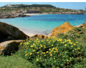
Praia y Pazo do Almacén, nuestra bienvenida a Sálvora.

La isla de Sálvora cuenta con dos itinerarios señalizados, uno de acceso libre y otro que solo se puede realizar en compañía de guías autorizados por el Parque Nacional, por razones de seguridad y conservación.