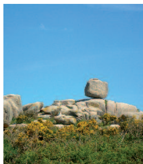
Sálvora, una isla de esculturas.

Después nos recibirá la sirena de Sálvora, escultura que uno de los propietarios de la isla mandó erigir para perpetuar en la memoria su noble pasado. Detrás de ella se encuentra el Pazo de Goyanes, construido sobre un antiguo almacén de curado y salazón de pescado y una pequeña capilla, que antes fue la taberna donde se reunían los pescadores. Accederemos al mismo a través de una pasarela que protege el frágil y valioso ecosistema dunar. Un antiguo cañón, así como algunos de los pilones donde se depositaba el pescado en salmuera y que aún se pueden observar en el interior del pazo, nos transportarán a épocas pasadas.