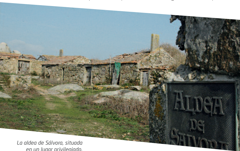
La aldea de Sálvora, situada en un lugar privilegiado.

A mitad de camino, un grupo de sauces nos indicará que hemos llegado a la fuente de Santa Catalina, conocida anteriormente como la "Fonte da Telleira" y la más importante de la isla, que veremos a nuestra izquierda. Un poco antes de llegar a la aldea podremos