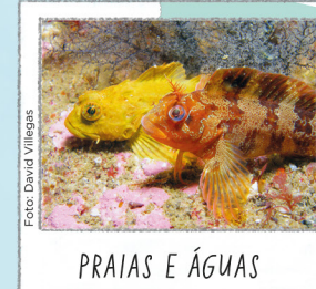
PRAIAS E ÁGUAS

Nas rochas mais próximas das praias vê-se uma grande variedade de vida marinha. Descubra-a com uns óculos de mergulho. Desfrute dela sem lhe tocar. Para usar cinto de mergulho é necessário autorização.