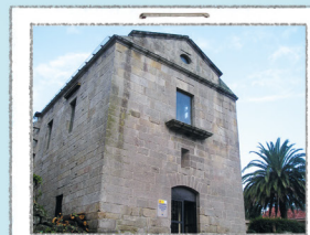
PONTO DE INFORMAÇÃO

Antigo mosteiro de S. Estevo. Na sua exposição interior poderá descobrir o escultor que molda a vida nas ilhas. Consultar horários.