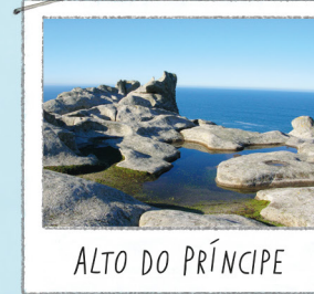
ALTO DO PRÍNCIPE

Uma rocha furada pelo vento e pelo sal. Do observatório mais próximo apreciam-se bonitas vistas do lago e das falésias.