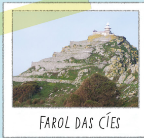
FAROL DAS CÍES

Situado no ponto mais alto visitável. Bom sítio para contemplar a falésia e o voo das gaivotas que ali procriam. Para não alterar as aves, não se aproxime nem as alimente.