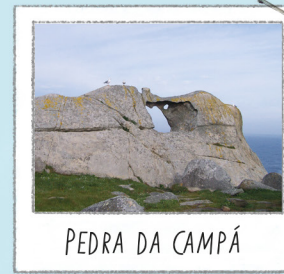
PEDRA DA CAMPÁ

Situado no ponto mais alto visitável. Bom sítio para contemplar a falésia e o voo das gaivotas que ali procriam. Para não alterar as aves, não se aproxime nem as alimente.