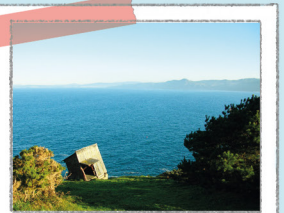
OBSERVATÓRIO DO PEITO

Um remanso no oceano, é um refúgio para a vida marinha. Ao passear pelo seu dique podem ver-se diversos peixes. Para não alterar os seus costumes, não deve alimentá-los nem tomar banho no lago.