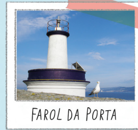
FAROL DA PORTA

Antigo mosteiro de S. Estevo. Na sua exposição interior poderá descobrir o escultor que molda a vida nas ilhas. Consultar horários.