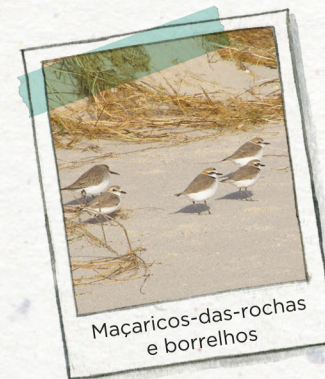
Maçaricos-das-rochas e borrelhos

AS PRAIAS encontram-se na costa mais tranquila, onde o mar deposita as areias. Estas areias são retidas pelas plantas da duna, evitando assim a erosão da praia.